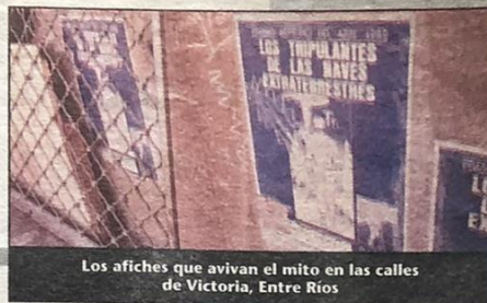
Los afiches que avivan el mito en las calles de Victoria, Entre Ríos