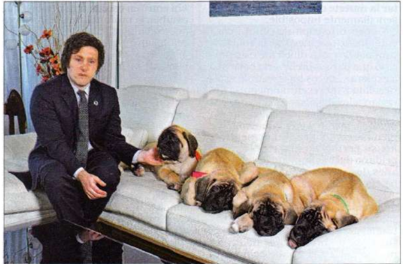
SU "FAMILIA". Milei mandó a clonar a Conan, su perro-hijo que murió, en Estados Unidos. Según él, el can fallecido le abre un "canal de luz" que le permite hablar con Dios.

La inminente desaparición del can lo enfrentaba, además, con su propia soledad. No tenía novia, su único amigo real era el economista Diego Giacomini, y en ese momento tampoco mantenía relación con sus "progenitores", como los llamaba. Su hermana Karina y Conan eran casi toda su vida. O toda, como daba a entender en las entrevistas que